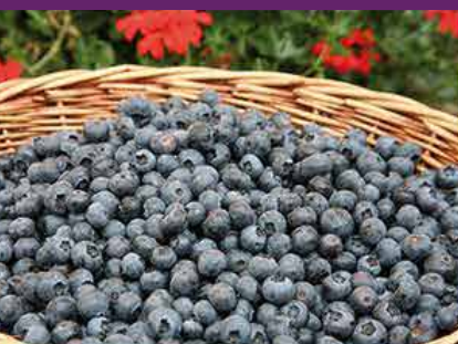
Les bluets des Vosges

Eaux de vie - Liqueurs - Crèmes - Amers Fruits à la liqueur - Absinthes - Gins - Whiskies