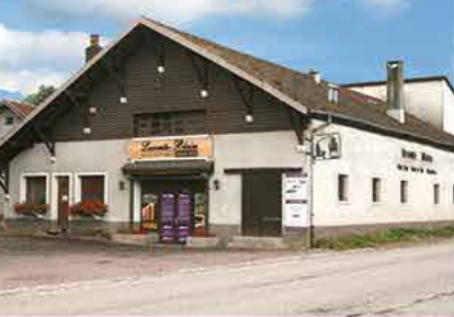
Au cœur des Vosges