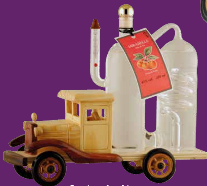
Camion alambic avec eau de vie de Mirabelle