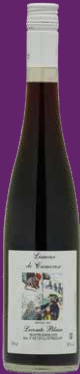
Liqueur de Camerise