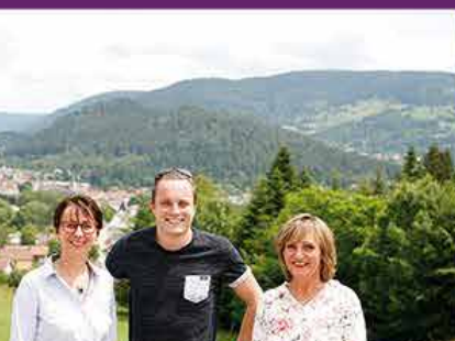
Un accueil chaleureux

Eaux de vie - Liqueurs - Crèmes - Amers Fruits à la liqueur - Absinthes - Gins - Whiskies