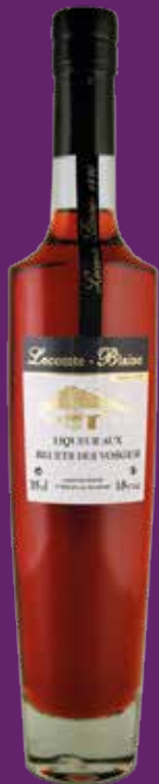
Liqueur aux bluets des Vosges