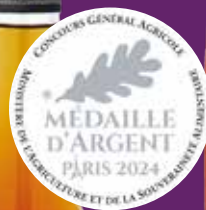
Liqueur de gènépi