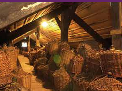
Bonbonnes dans le grenier