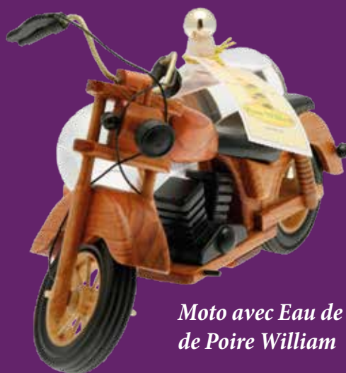
Moto avec Eau de Vie de Poire William