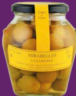
Mirabelles à la liqueur 35cl