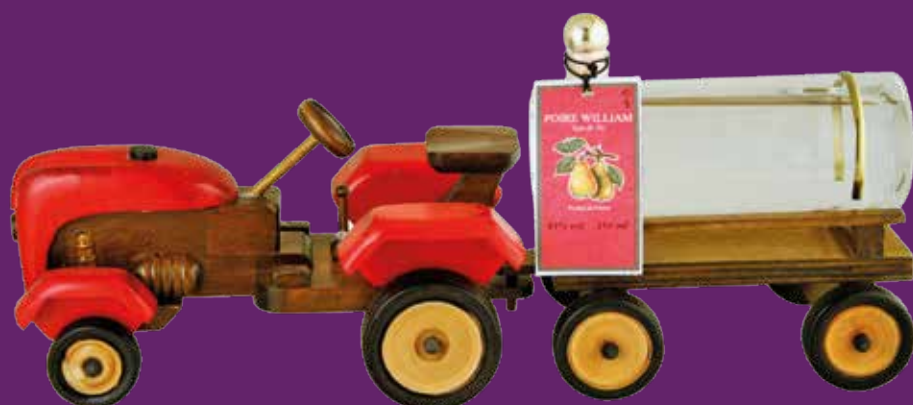
Tracteur avec Eau de Vie de Poire William