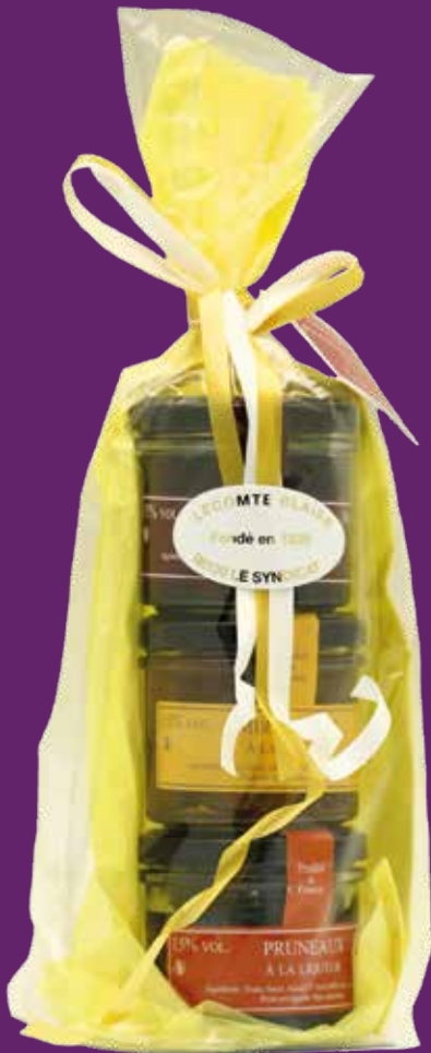
Trio de fruits