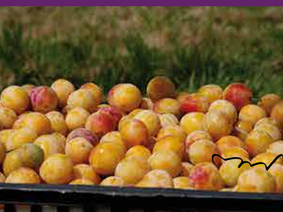
La mirabelle : fruit d'or de la Lorraine