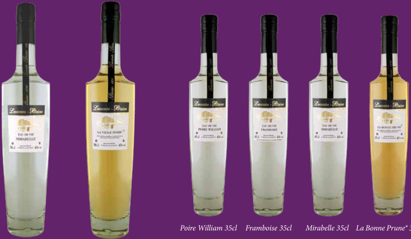
Mirabelle 50cl La Vieille Poire® 50cl