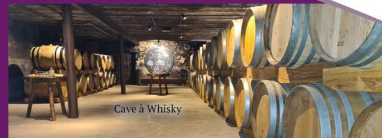
Cave à Whisky

En juillet - août, rendez-vous tous les mercredis à 16h pour une visite guidée de la cave avec dégustation de Whisky.